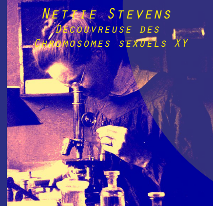
NETTIE STEVENS DECouvreuse DES CHROMOSOMES SEXUELS XY