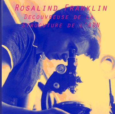
ROSALIND FRANKLIN DECouvreuse DE LA STRUCTURE DE L'ADN